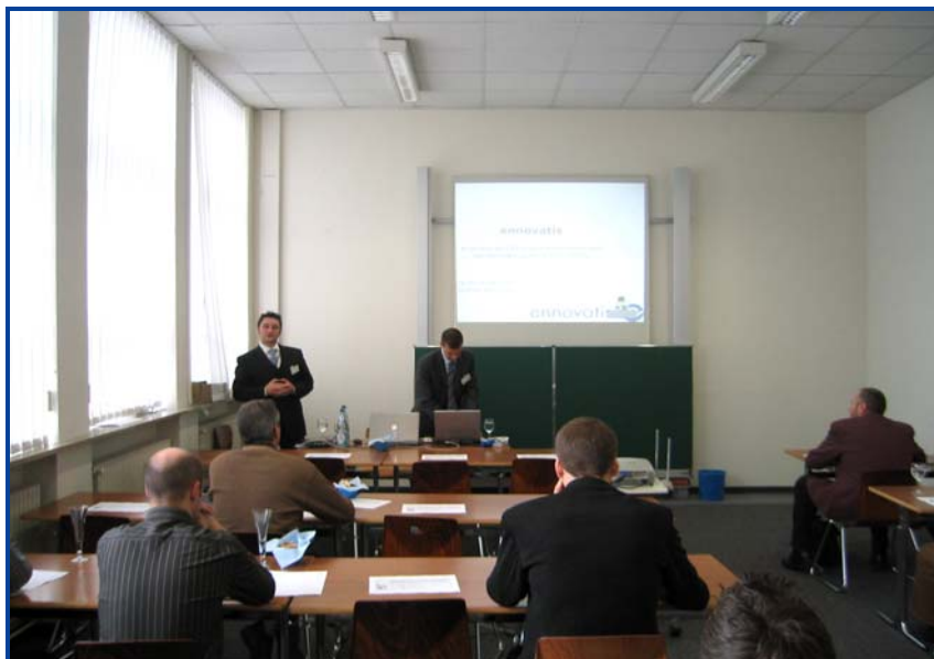
Bild: Schulungsveranstaltung im Hause EuSIS

Die Installation von Updates können in den meisten Fällen vom Administrator des Systems durchgeführt werden. Sie werden rechtzeitig über neues Updates informiert. Die Updates können Sie schnell und bequem über die Webseite www.smotive.de herunterladen. Sollten bei der Installation Komplikationen auftreten steht Ihnen unser sMOTIVE Support mit Rat und Tat zur Seite. Wir helfen Ihnen schnell unkompliziert. Sie werden zu jedem Zeitpunkt mit in die Fehleranalyse und –behebung einbezogen. Dies hat den Vorteil, dass Sie und unser Team zukünftig Fehler vermeiden.